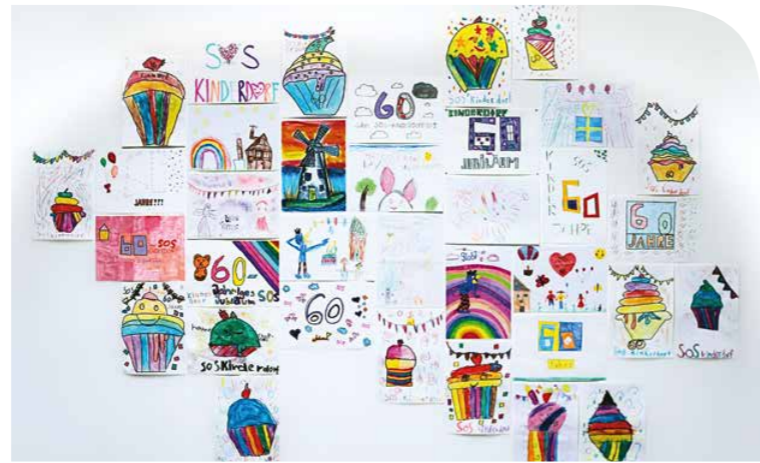
Eine Auswahl der Kunstwerke, die an einer unserer Bürowände ein fröhlicher Blickfang sind.

Im vergangenen Jahr wurde von SOS-Kinderdorf International eine neue Richtlinie zum Schutz von Kindern in Kraft gesetzt, die für alle Mitgliedsverbände rechtsverbindlich ist. Folgende Bereiche sind in dieser Richtlinie definiert: Prävention, Sensibilisierung und Schulung, Meldung von Bedenken und Vorfällen, Reaktion, Monitoring und Evaluation und Verantwortlichkeiten. In den kommenden SOS-ZOOM-Ausgaben stellen wir jeweils einen dieser Aspekte genauer vor, um unsere Anstrengungen und Fortschritte im Bereich Kinderschutz zu erläutern.