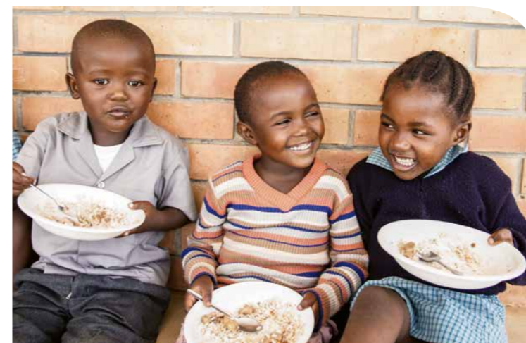
Essen ist nicht nur lebensnotwendig, sondern gemeinsam (wie hier in Äthiopien) auch ein soziales Erlebnis, das verbindet.

Gemeinsam zu essen und genug zu essen zu haben, ist vielerorts leider keine Selbstverständlichkeit. Pôramesa unterstützt SOS-Kinderdorf, mehr Kinder und Familien vor Hunger zu schützen.